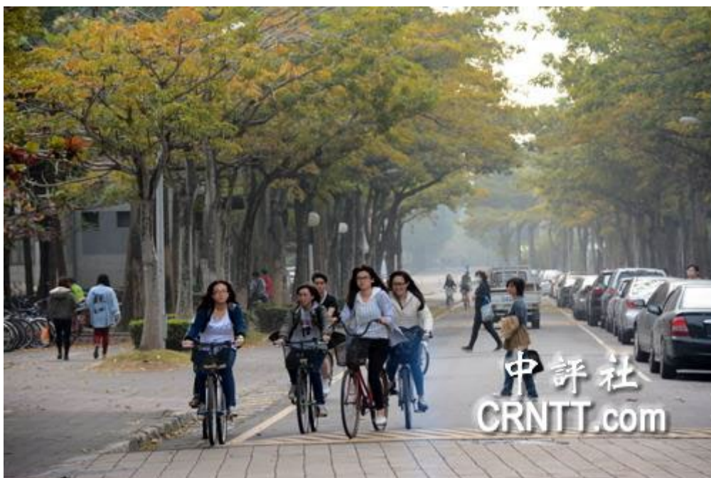
雲林科技大學校園綠覆率相當高。

侯春看還說，國科會以往考評大學，都偏重論文多寡，如今大環境改變，也開始重視創新創業能力，學校一直把自己定位在如同美國麻省理工學院一樣，培養專業技職人才，他以和某知名輪胎公司產學合作為例，學校幫輪胎業者作員工在職訓練，學生也可以工廠實習甚至就業，這種合作方式就是大陸所謂的訂單式合作。