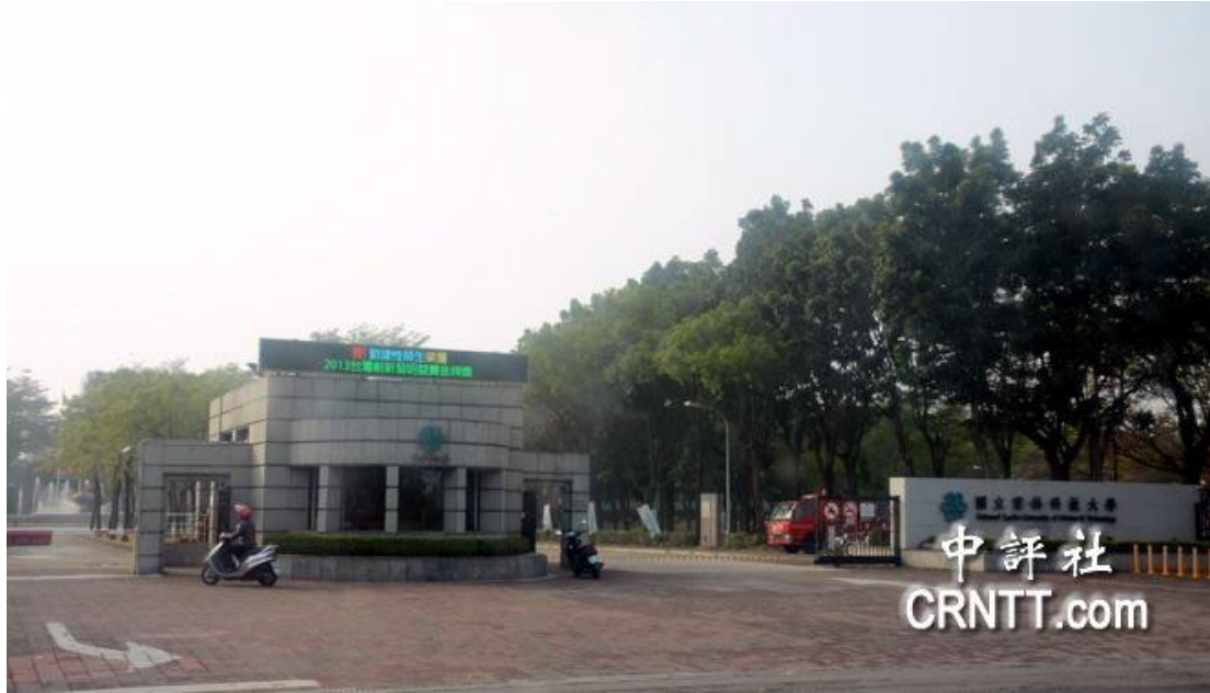
雲林科技大學是台灣名列前茅的技職體系大學，兩岸學術交流也非常密切。