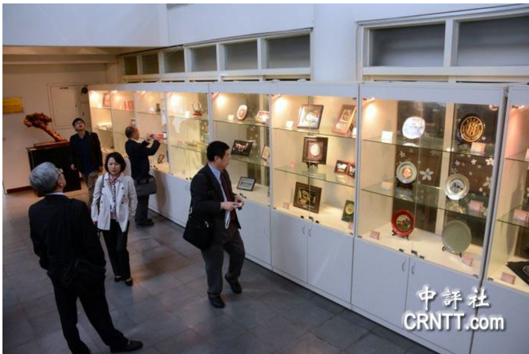
雲林科技大學將中國大陸各姐妹校致贈的紀念品開闢專室陳列展示。