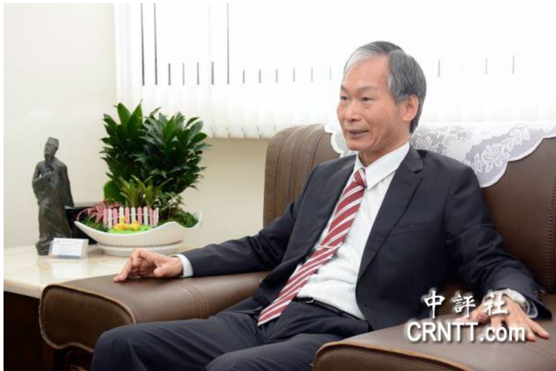
雲林科技大學校長侯春看。